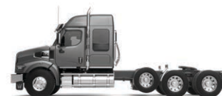
48 po Toit élevé