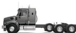
36 po Toit surbaissé type tranchée Disponible avec toit élevé