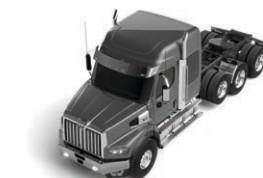
72 po Stratosphere toit surélevé Disponible avec toit élevé